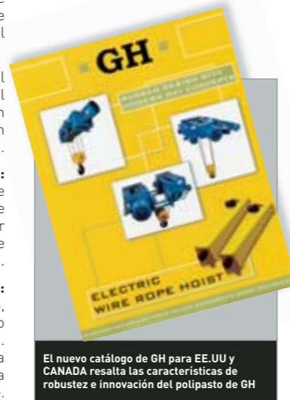
El nuevo catálogo de GH para EE.UU y CANADA resalta las características de robustez e innovación del polipasto de GH

Todas estas características hacen que nuestros atributos de ROBUSTEZ e INNOVACION tengan plena vigencia para definir no sólo la cultura de la empresa, sino todos los productos que hace más de 50 años fabrica GH.